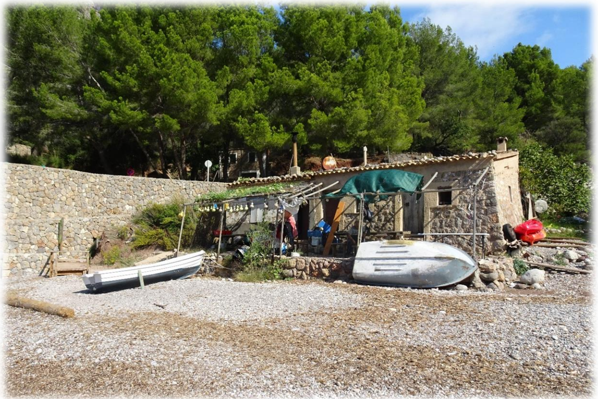
Op Cala Tuent staat er één huisje. Vroeger woonde er een eenzaat in maar momenteel staat het huisje leeg. Vermoedelijk is de kluisenaar overleden.