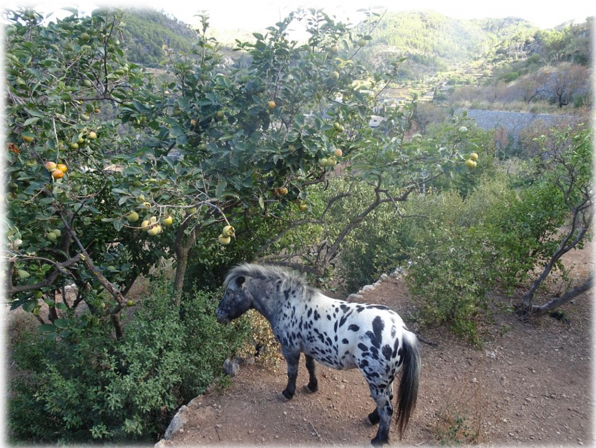
Een mooie ponny staat onder een citroenboom. Een citroenboom is de enige boom die 3 maal vruchten draagt in het seizoen.