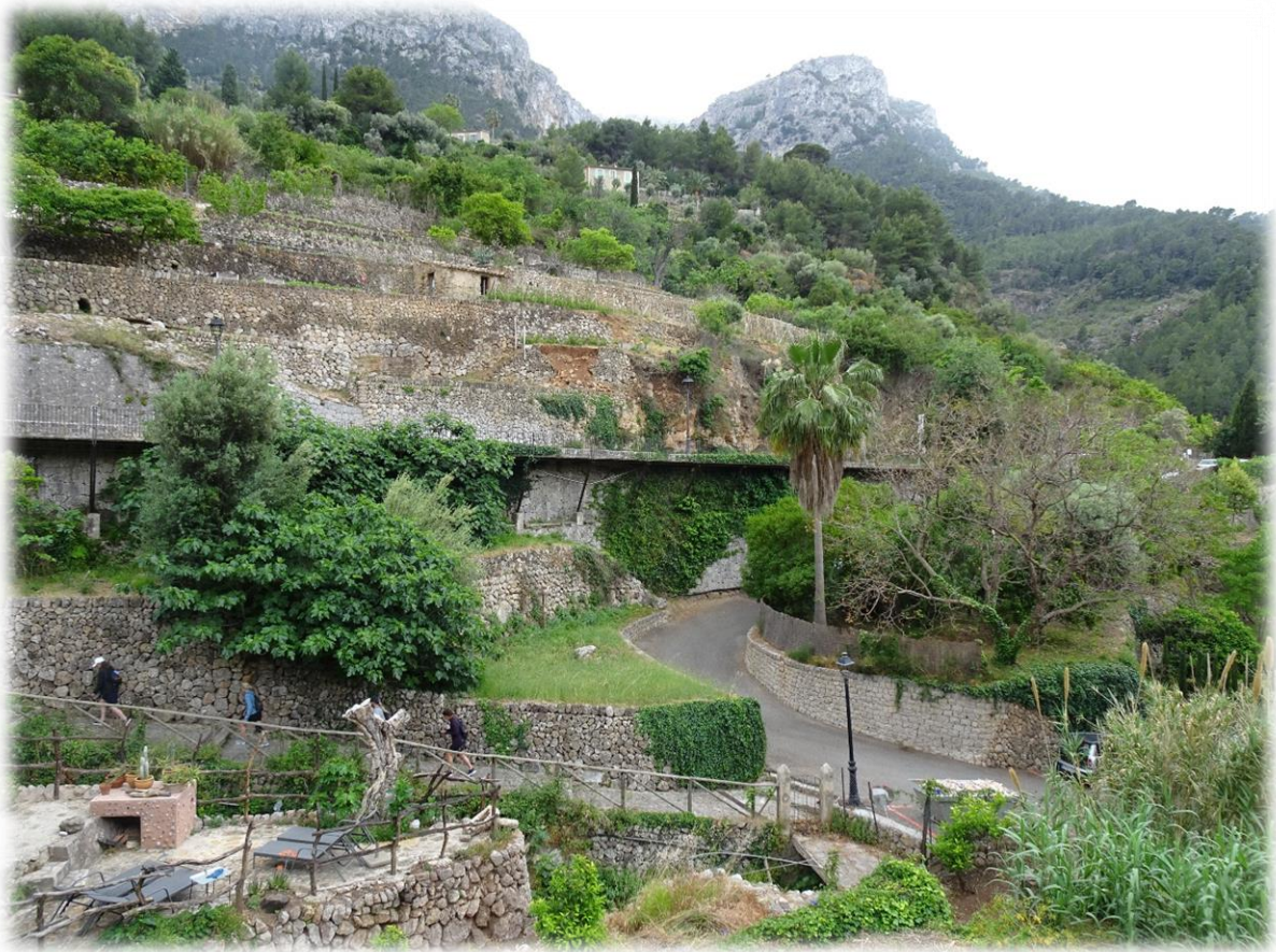
Het kleine kustplaatsje Deià, aan de noordwestkust van Mallorca, is een van de mooiste dorpen van het eiland. Gelegen in een vallei aan de voet van de berg Teix is Deià al jaren een