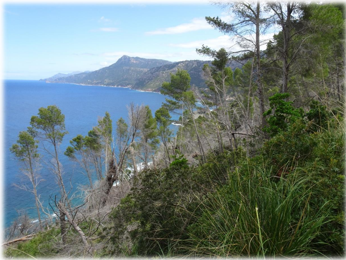
Banyalbufar ligt relatief hoog in de heuvels van de Serra de Tramuntana. Toch is het dorp in het bezit van een eigen strand. De weg hiernaartoe is lastig, lang en erg steil naar beneden