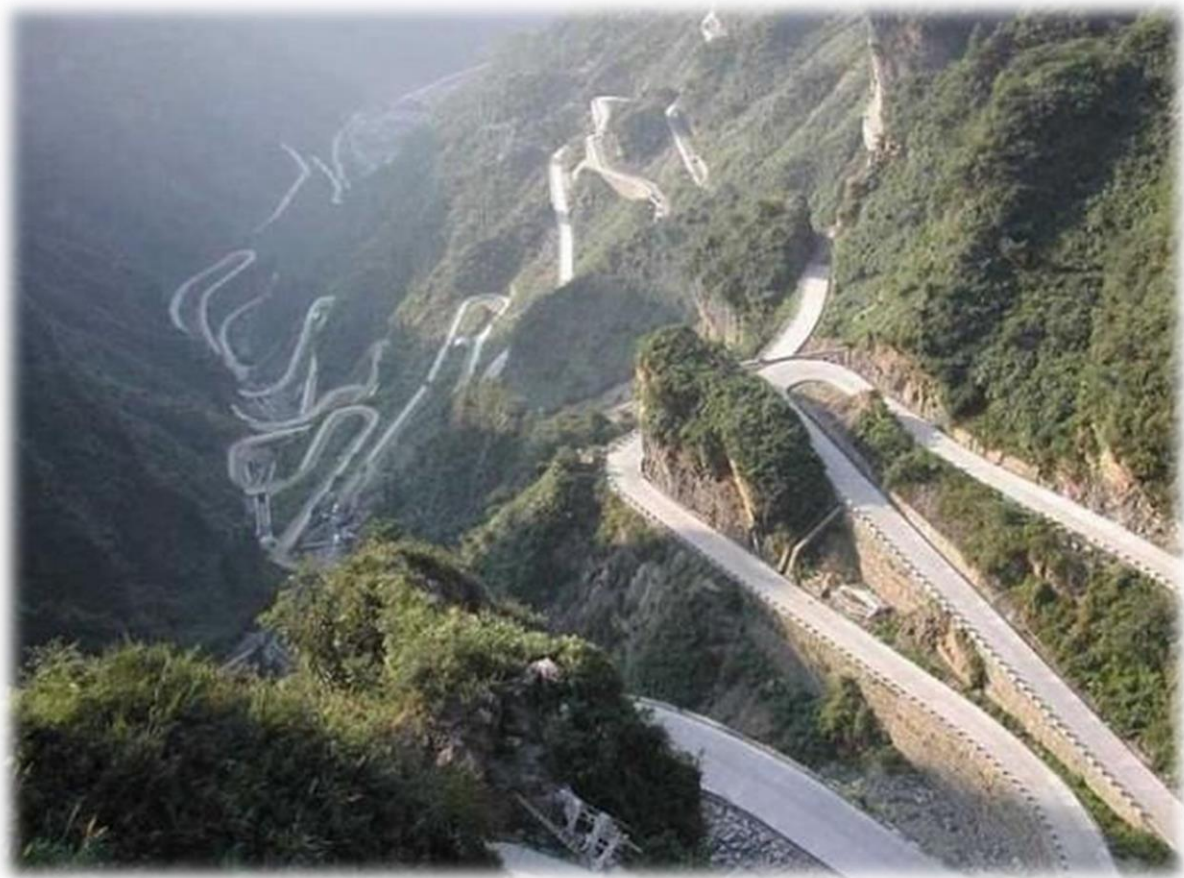
De Cala de sa Calobra (Slangenbaai), die naast Cala Tuent is gelegen, dankt haar naam aan de als een slang in haarspeldbochten naar de zee omlaag kronkelende weg.