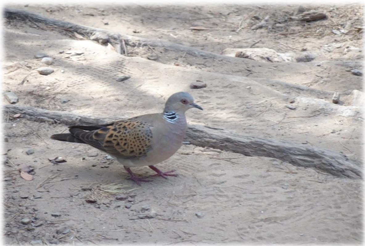
De zomertortelduif is de kleinste Europese duif en is redelijk schuw. Ze overwintert in Afrika ten zuiden van de Sahara maar broedt in grote delen van Europa.