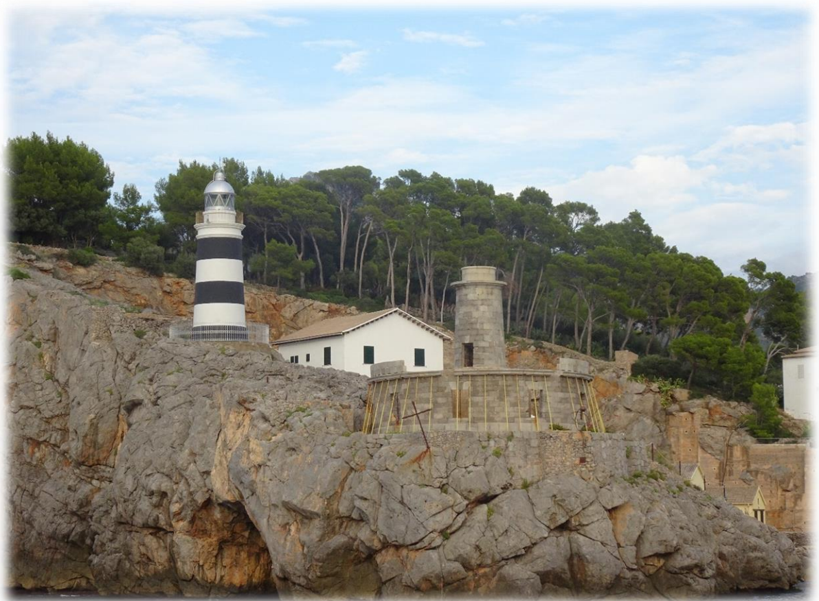
Vlak voor de haven van Port de Sollèr is er een vuurtoren met enkele gebouwen. Dit is militair domein.