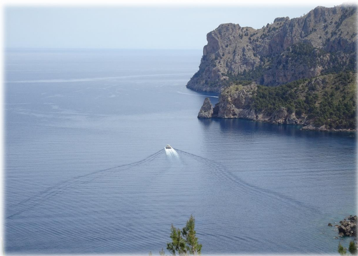
De zee komt in zicht.